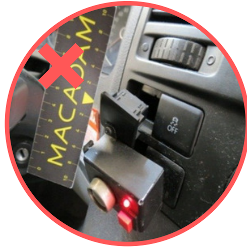
Niet originele gemonteerde accessoires.